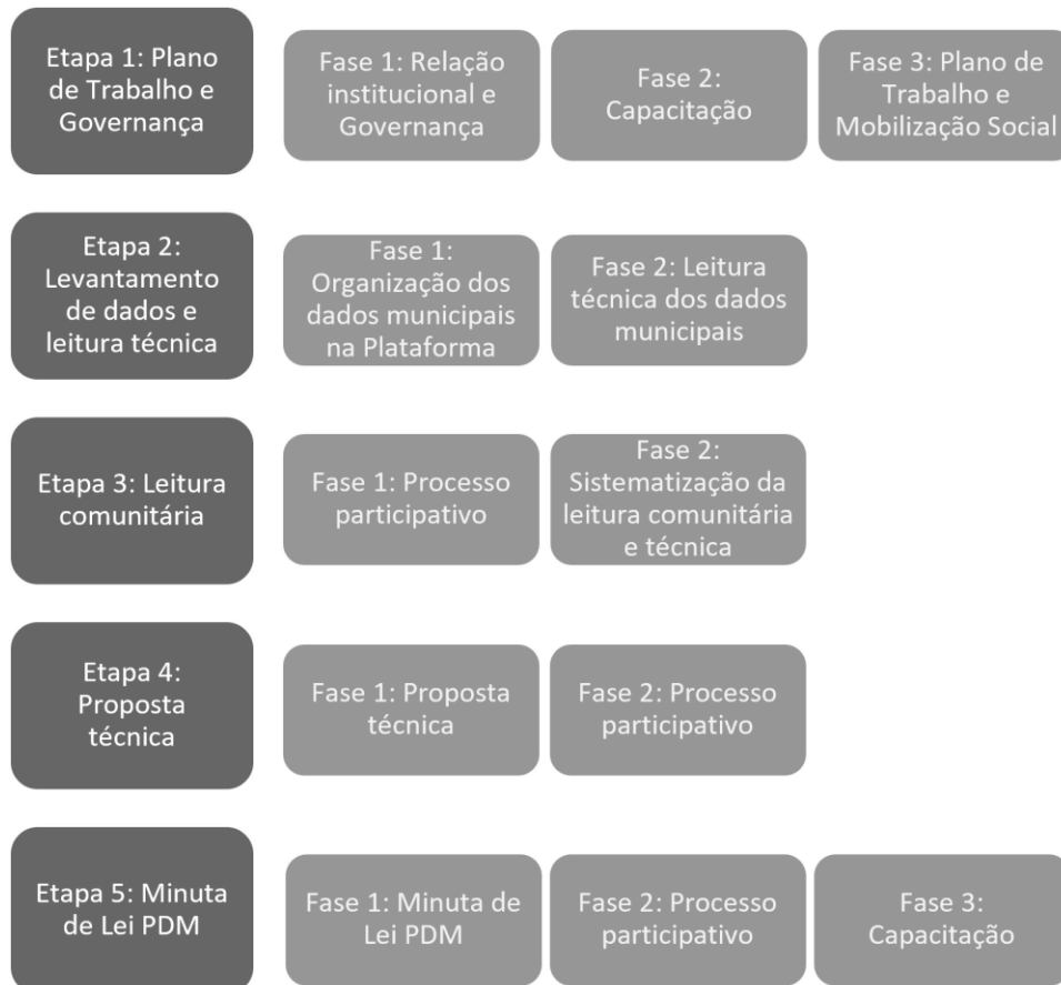
Figura 2.2-1: Etapas dos trabalhos