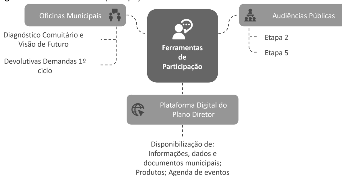
Figura 3.2-1: Ferramentas da participação social

Diante da importância do processo participativo nas diversas fases do projeto, serão promovidas estratégias (vide Figura 3.2-1 ) com vistas a assegurar a participação da população, de modo a fomentar a corresponsabilidade da comunidade local com o resultado do trabalho a ser desenvolvido.